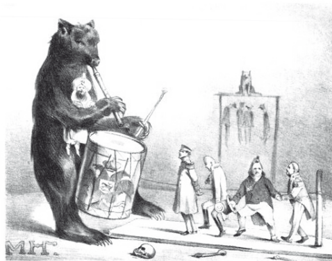
ОНИ ВСЕ ПЛЯШУТ ПОД ЕГО ДУДКУ

В качестве медведя Россия предстала, безу-