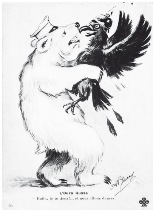
Французская карикатура об отношениях России и Пруссии

словно, на Западе, в XVIII веке (а может, и еще раньше). Европа с пренебрежением, но и со страхом смотрела на выходящее из дремучих лесов на просторы мировой политики государство Российское.