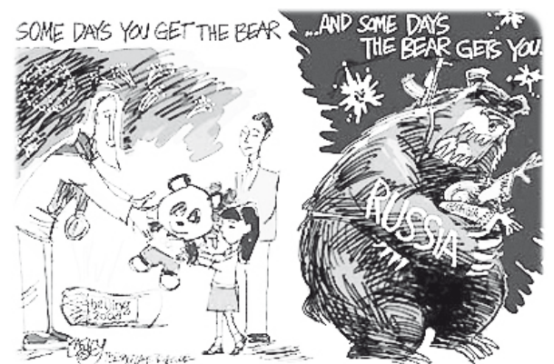
«Иногда ты обнимаешь мишку... И иногда мишка обнимает тебя...» - 08.08.08 - начало войны в Южной Осетии

западные СМИ называют так российские бомбардировщики Ту-95 или россиян на ринге (например, Олега Тактарова). Ну а про "Красного Медведя" скромно промолчим, этот символ Советской угрозы в западных странах успешно перемещался из газет и журналов на телеэкраны и в речи политиков. Русский Медведь постоянный герой политических фельетонов и памфлетов и уже 300 лет занимает важное место в карикатуре, причем уже не только со стороны Запада.